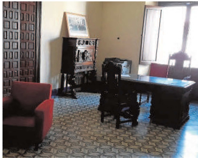
Dependencias del Colegio de Abogados en los juzgados de Écija

Los dos principales déficits detectados en este análisis son los que se arrastran desde hace largo tiempo: los retrasos acumulados en la instrucción y enjuiciamiento de las causas y las obsoletas instalaciones que acogen en la mayoría de los pueblos cabezas de partidos los juzgados. Pero a estas carencias hay que sumar algunas otras como la accesibilidad de estos viejos edificios, muchos de ellos con dos plan-