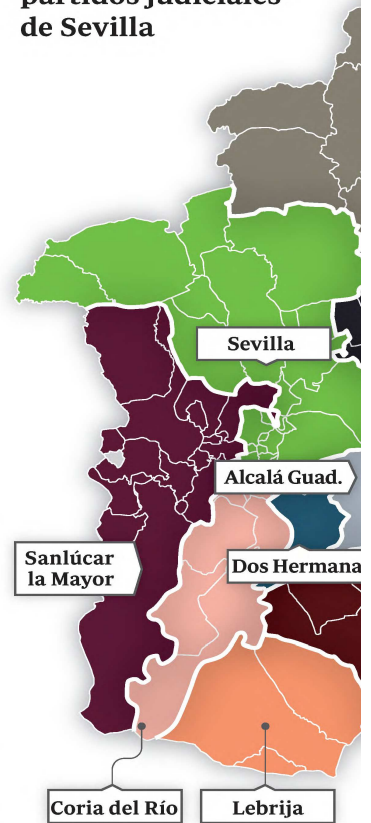
Mapa de los quince partidos judiciales de Sevilla

El análisis del Colegio de Abogados evidencia problemas de accesibilidad o con el acceso a Internet