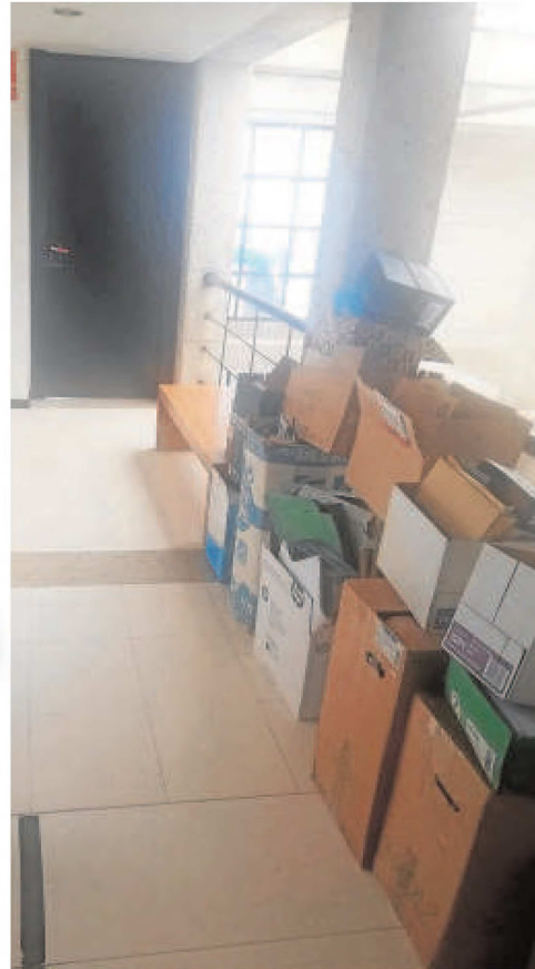
Abogados y víctimas en Lebrija se reúnen en un banco